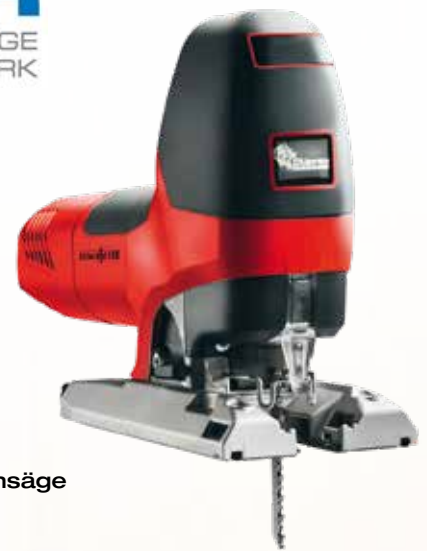
Präzisionsstichsäge P1 cc MaxiMAX im T-MAX Art.Nr. 917103