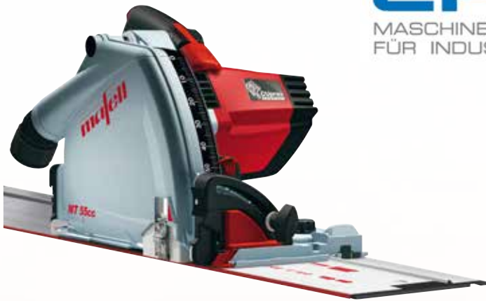
Tauchsäge MT 55 cc MidiMAX im T-MAX mit F 160 Art.Nr.: 917613