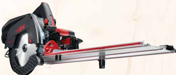
Kappschiene-Säge KSS 50 cc im Transportkoffer Art.Nr.: 918902