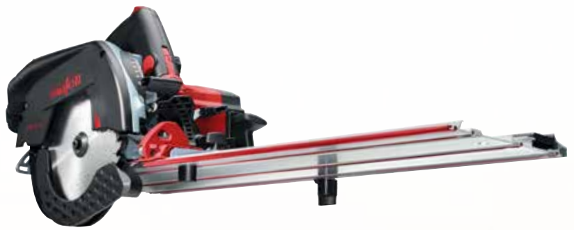
Kappschiene-Säge KSS 50 18M bl