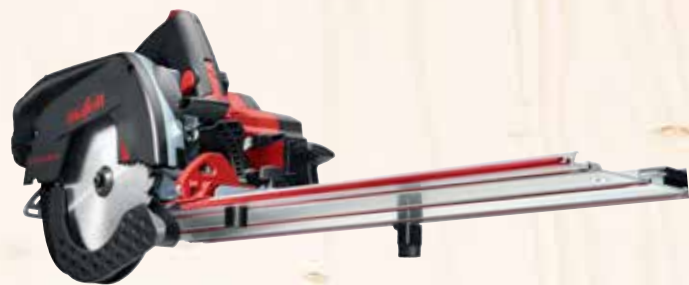
Kappschiene-Säge KSS 60 18M bl