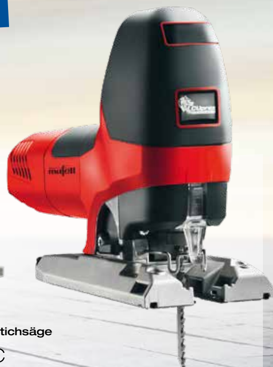
Präzisionsstichsäge P1 cc MaxiMAX im T-MAX Art.Nr.: 917103