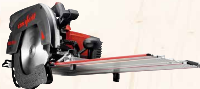
Kappschiene-Säge KSS 80 cc /370